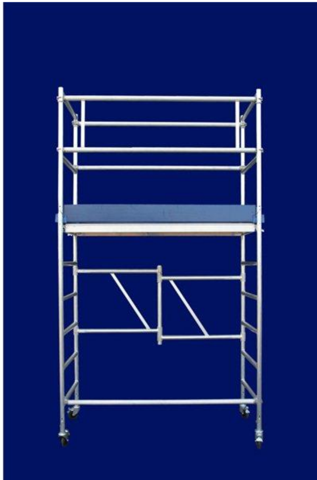
Aufbau mit Arbeitshöhe 3,85 Meter